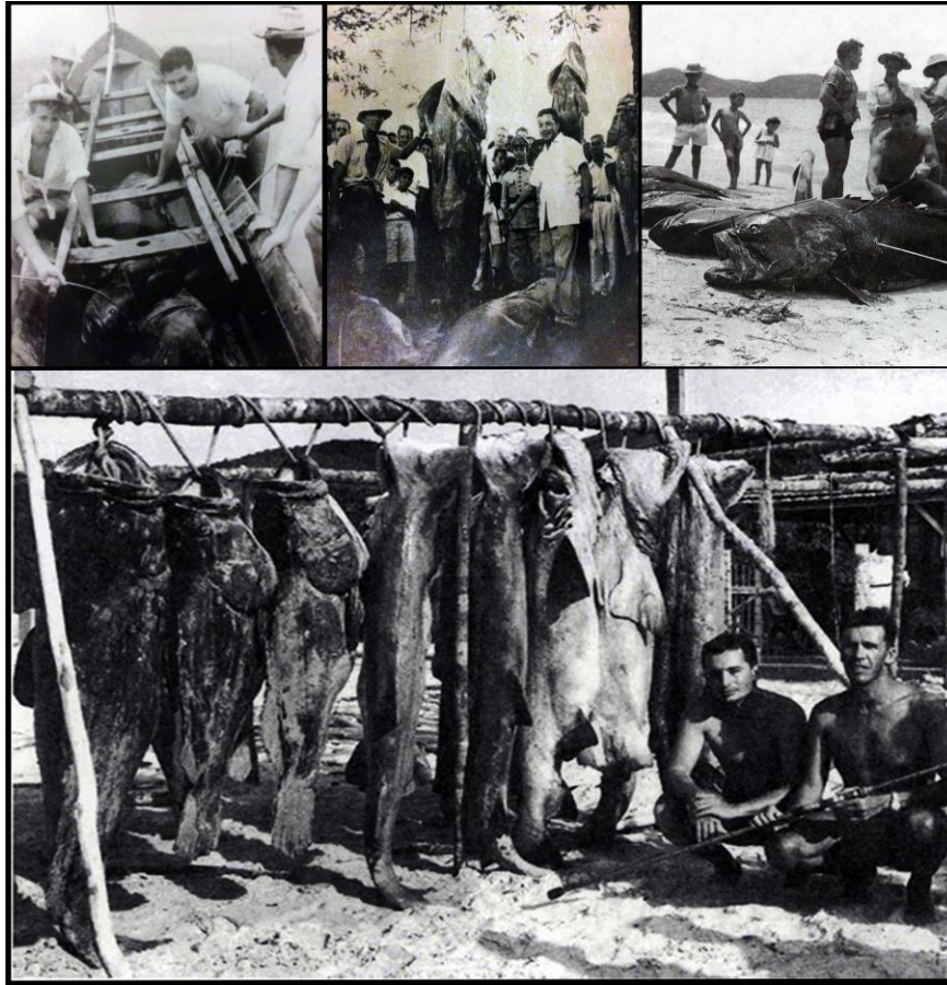
Figura 3: Pescarias na Ilha de Santa Catarina realizadas nas décadas de 1950 e 60. Abundância de tubarões ( Carcharias taurus : cação mangona) e meros ( Epinephelus Itajara ).

A estrutura das comunidades de predadores de topo como observamos hoje, são reflexos pálidos, da real diversidade e abundância de décadas atrás. Souza (O Homem da Ilha, 2000) relata que na Ilha da Galé, no ano de 1960, dois caçadores submarinos, em mergulho livre (apnéia) (Figura 3), pescaram em aproximadamente 3h de mergulho cinco cações-mangona ( Carcharias taurus ) e três meros ( Epinephelus itajara ) que somaram 720 kg. Esses dados são espantosos, pois levam a crer que, a menos de 50 anos atrás, os recifes rochosos da costa de Santa Catarina encontravam-se ainda num estado muito mais conservado. Somando-se 13h de mergulho feitos por cinco mergulhadores durante a coleta de dados no âmbito do Projeto Ilhas do Sul nas mesmas ilhas, foram registrados apenas 282 kg de peixes (todos os grupos tróficos juntos) no total.